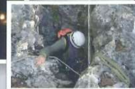
Espeleo en la "Sima Gorda"