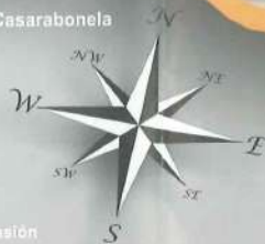
Termino Municipal de Casarabonela