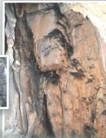
Interior de la Sima