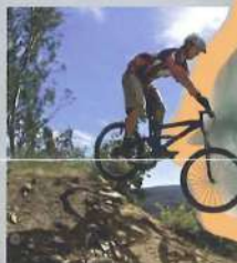
Rutas en Bici